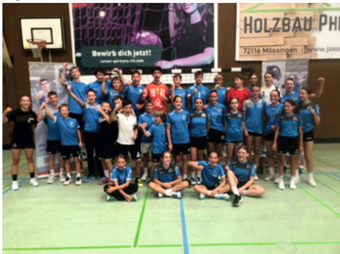
Sommerncamp 2023 – die Halle war voll.