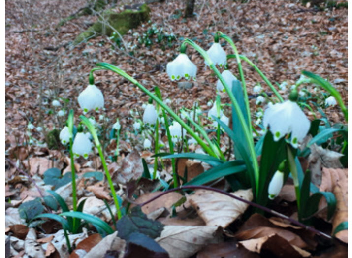
Die Märzenbecherblüte kündigt das Frühjahr an.