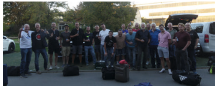
gesellschaftlicher Höhepunkt 2023 - Ausflug nach Ravensburg

Ganzjährig jeden Mittwoch, halb neun, Rasenplatz an der Langgaß, zwei Tore, ein Ball, dazu zwischen 15 und 25 Kicker - SpVgg-Altherrenfußball ist ganz einfach! Diese Kontinuität der Trainingsbeteiligung, der Zusammenhalt von Alt und Jung, der Spaß und der nötige Ernst auf dem Platz, die Unternehmungen, Ausflüge, Projekte und die gemeinsame Zeit nach dem Kick in der Kabine oder am Stammtisch mit unseren Muppets, lässt uns als Truppe weiterwachsen und auch die neuen Kicker integrieren sich bestens.