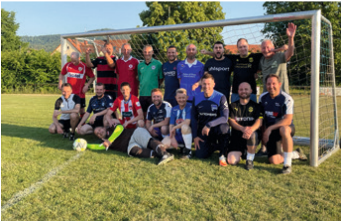
Training am Tag des Trikots

Die 74. Auflage des traditionellen Steinlach-Cups fand in Bodelshausen statt. Eine gut aufgestellte reine AH-Truppe mit einer gesunden Mischung aus „alt und erfahren“ und „jung und bißle wild“ wollte das schlechte Abschneiden vom letzten Jahr in Gomaringen ausmerzen – und das sollte auch gelingen.