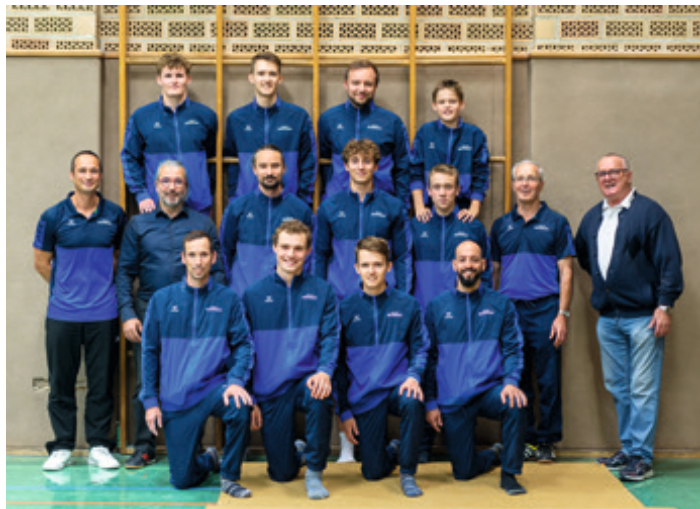
Die Herrenmannschaft für die Landesliga 2024

November: Beim diesjährigen Herbstfest in Riederich war Mössingen mit 3 Mannschaften vertreten. Eine Mannschaft besteht aus bis zu 8 Turnerinnen, von denen 5 Mädels pro Gerät turnen und die 3 besten Wertungen pro Gerät zum Gesamtergebnis zählen. Die E- und D- Jugend startete direkt morgens und konnte im stark besetzten Teilnehmerfeld weitere Wettkampferfahrungen sammeln. Am Ende landeten sie auf Platz 15 (E-Jugend) und Platz 8 (D-Jugend). Im zweiten Durchgang turnte unsere C-Jugend ihre Übungen und erreichte den 5. Platz.