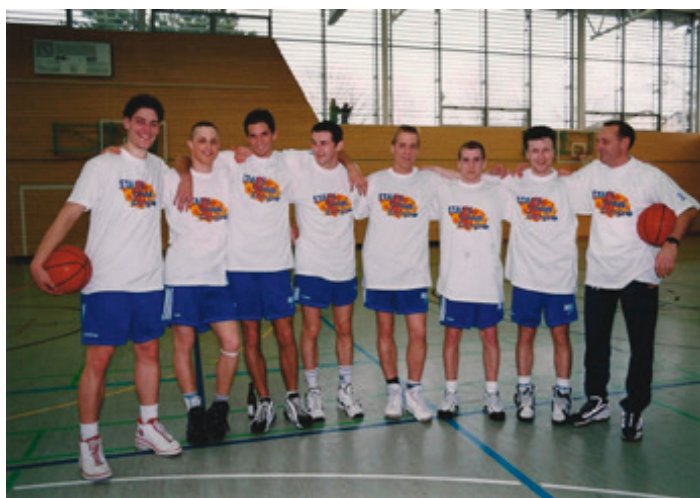
Das Meisterteam der Saison 1997/98

Der damalige Erfolg dieser Mannschaft und sicherlich auch die ansteigende Popularität der NBA haben nach und nach dazu geführt, dass sich in Mössingen auch Jugendmannschaften gebildet haben. In der Saison 2003/2004 ging es gleich mit mehreren Teams in den Spielbetrieb.