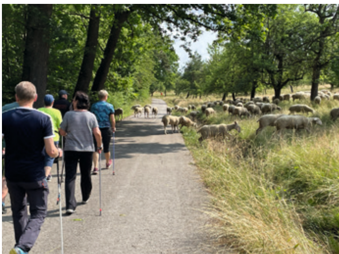
Was wären unsere Streuobstwiesen ohne unseren Schäfer mit seiner Herde. Idylle pur!