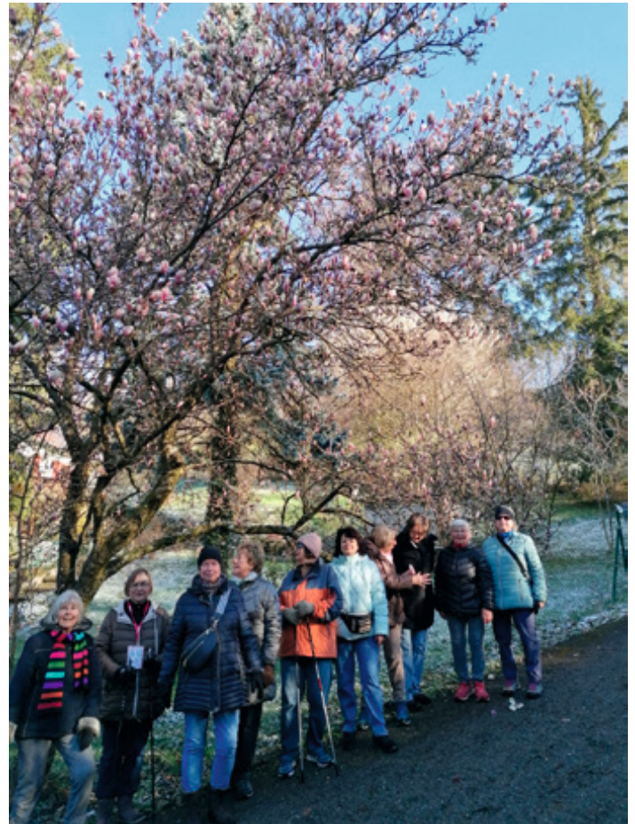
Unser Magnolienbaum ist wieder erblüht am Rande des Firstwaldes