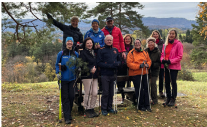
Unsere Truppe vom Samstag