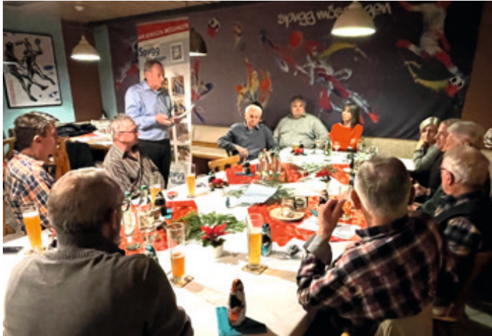
Das Jahr neigt sich dem Ende zu, mit Tannengrün und Schoko-Nikolaus. Die finale Ehrung im Dezember.

Mehr Informationen zu den Ehrungen in den Amtsblatt-Ausgabe aus Mai und Dezember 2023 (im Archiv auf der Homepage der Stadt Mössingen). Bilder in der Foto-Galerie der Sportvereinigung, Homepage.