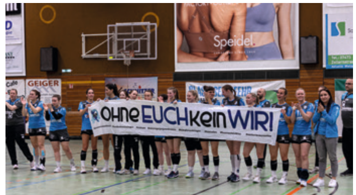
Ohne Euch kein wir! Die Handballabteilung bedankt sich bei allen Freunden, Förderern und Fans für die tolle Unterstützung im vergangenen Jahr!!!

Wie immer im Handball, sind auch diese Seiten den Anstrengungen eines Teams zu verdanken. Beteiligt waren: Roman Midinet, Claudia Fröhlich, Florian Seidel.