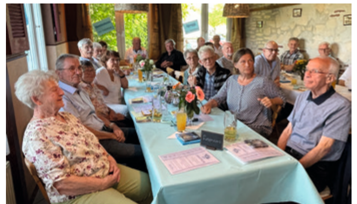
Einer spricht und alle hören aufmerksam zu. „Vereinsdisziplin“.

Ja, die Sport-Senioren haben sehr viel zu berichten aus der langen aktiven Zeit und auch über die Zeit danach.