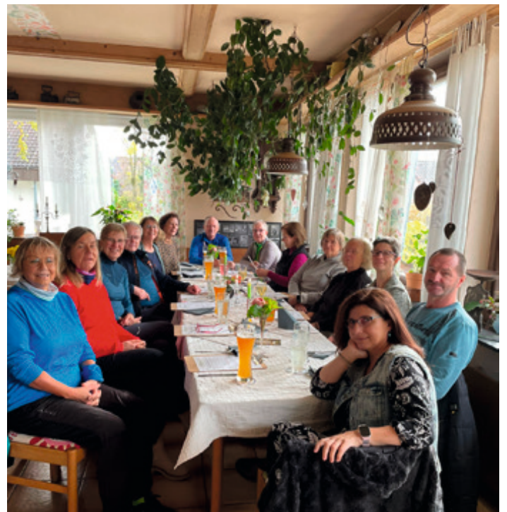
Geselligkeit kommt nicht zu kurz in dieser Runde. Manchmal sitzen wir noch gern beieinander nach getaner Walkingtour.