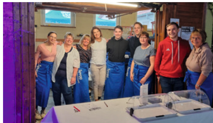
Ein besonderer Dank an das neue Orga-Team, jetzt weiblich und hoch motiviert, und an die zahlreichen Helfer aus den Abteilungen.

... auf der besten Mai-Party in Town, in der Mössinger Walpurgisnacht, ohne Besen und Feuer mit sehr netten und hübschen Hexen. TidM, ein wohl unerlässlicher Beitrag zum Mössinger Nachtleben.