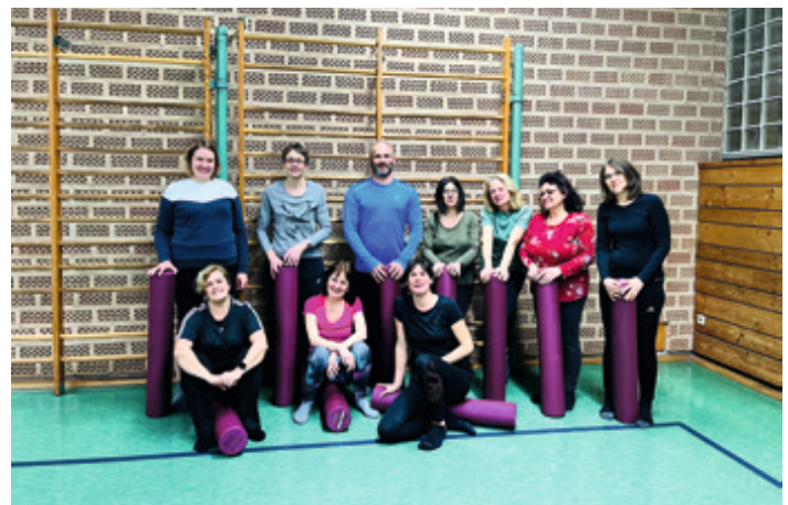
Pilates (226) Kraft- und Beweglichkeitstraining für den ganzen Körper für alle die Lust haben Mittwochs, 19:30 - 20:30 Uhr Leitung: Susanne Ajen