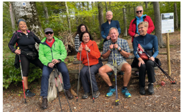
Auf dem Genussweg in Erpfingen Oktober 2023