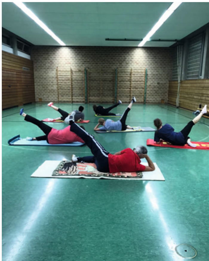
Funktionelles Fitnessstraining (213)

Anders als in den Coronajahren verzeichnet die Fitness- und Gesundheitsbranche eine positive Entwicklung. Menschen suchen nach den langen Schließungsperioden aktiv den Weg zu Fitnessangeboten. Das Bewusstsein für die eigene Gesundheit ist erfreulicherweise gewachsen.