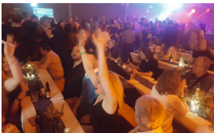
Ausgiebig zusammen getanzt, gesungen und auch zusammen a'bisle getrunken.