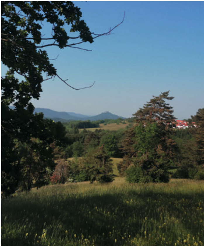
In der Ferne auch die Burg Hohenzollern im Blick