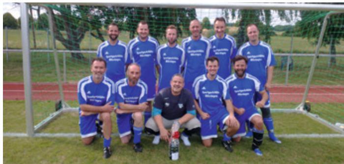
2. Platz AH-SWP 2023

Ganzjährig jeden Mittwoch, halb neun, Rasenplatz an der Langgaß, zwei Tore, ein Ball, dazu zwischen 15 und 25 Kicker - SpVgg-Altherrenfußball ist ganz einfach! Diese Kontinuität der Trainingsbeteiligung, der Zusammenhalt von Alt und Jung, der Spaß und der nötige Ernst auf dem Platz, die Unternehmungen, Ausflüge, Projekte und die gemeinsame Zeit nach dem Kick in der Kabine oder am Stammtisch mit unseren Muppets, lässt uns als Truppe weiterwachsen und auch die neuen Kicker integrieren sich bestens.