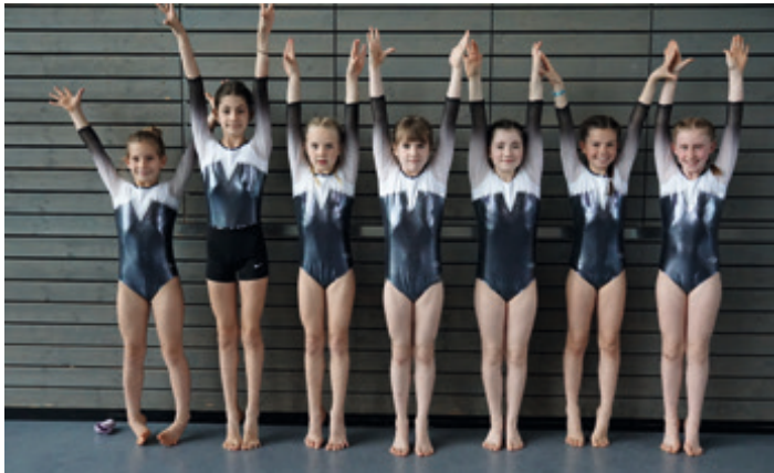
Die Turnerinnen nach ihrem erfolgreichen Wettkampf