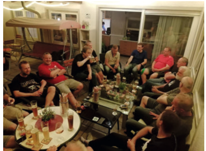
Kicker und Muppets