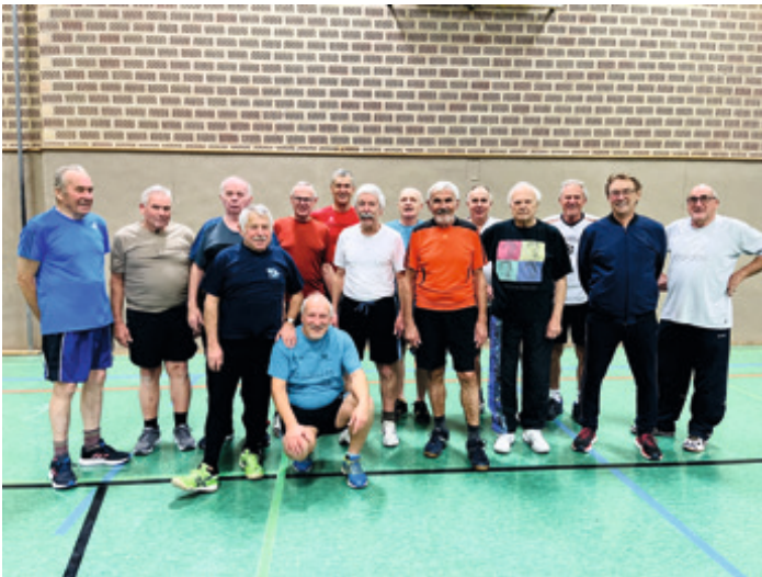
Jedermannsport (211) Spaß an der Bewegung in aktiver, fitter Truppe für Männer 60+ Montags, 20:00 - 21:00 Uhr Leitung: Manfred Witt