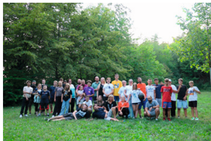
Auf dem Sommerfest im Juli 2023 fand fast die gesamte Abteilung zusammen

Eine tolle Gemeinschaft hat sich hier entwickelt. Das zeigt auch das große Interesse am Sommerfest der Abteilung im letzten Jahr. Neben den Spielern aller Mannschaften, nahmen auch Eltern und Geschwister daran teil.