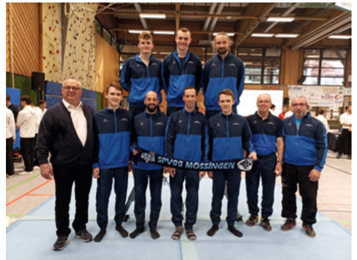
Das erfolgreiche Männerteam stieg in die Landesliga auf

Beim Bezirksliga-Endkampf der jeweils beiden Erstplatzierten der Gruppen Nord, Mitte und Süd in der Nürtinger Theodor-Eisenlohr-Halle gelang den Mössinger Turnern ein unerwarteter Erfolg. Mit 253,55 Punkten siegte die Spvgg knapp vor dem Gruppenfavoriten SV Dotternhausen (251,55) und dem TV Wetzgau III (251,50). Abweichend von der Vorrunde wurde beim Endkampf ohne Streichnote mit nur vier Turnern am Gerät geturnt. Dieser Umstand kam der Spvgg entgegen, da sie an keinem Gerät einen groben Einbruch zu verzeichnen hatte. Da dieses Ergebnis gleichzeitig in die Aufstiegs-Relegation einfluss, hat sich Mössingen auch souverän den Aufstieg in die Landesliga gesichert, die ab der Saison 2024 strukturell auf zwei Gruppen aufgeteilt wird.