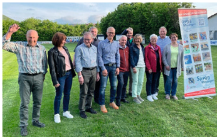
Die anwesenden Geehrten aus dem Ehrungsjahr 2020

Die meisten der ‚70er‘ kennen sich seit der Jugend, obwohl sie in unterschiedlichen Sportarten unterwegs waren.