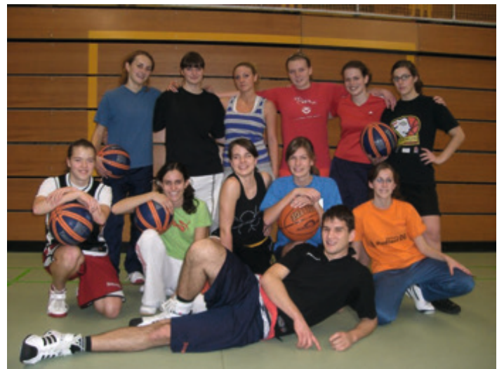
Woman Power! Die weibliche U18 der SpVgg Mössingen