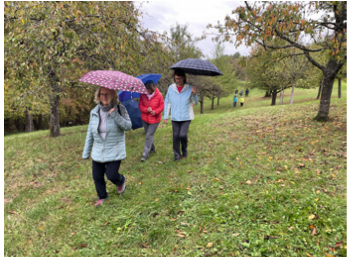
Oktober 2023 - hin und wieder kommt ein Schirm zum Einsatz.

August + September - 2023 ... trotz Ferien – wir gehen weiter – Gäste sind jederzeit willkommen – oft gehen in dieser Zeit Kinder / Enkelinder morgens mit.