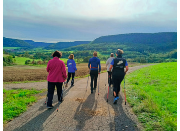
Unsere Natur rund um Mössingen ist einfach traumhaft schön.