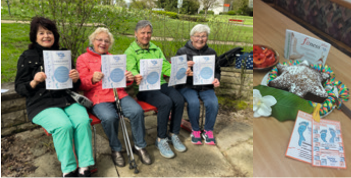
Januar 2023 - 12. Geburtstag unseres Treffs gefeiert und Ausgabe der neuen Mitgeh-Pässe