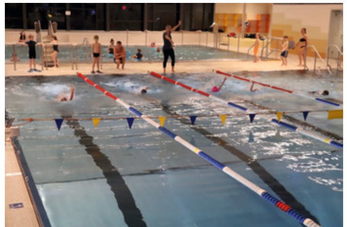
Unsere Jüngsten beim Rückenschwimmen