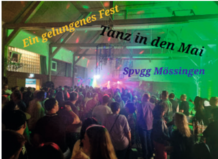
Volle Halle, tolle Stimmung, endlich wieder raus und feiern.

Alle hatten einen schönen und entspannten Abend/Nacht. Wieder mit Bekannten, Freunden und vorher noch nicht gekannten feiern, trinken und tanzen. DJ Lappi heizte (wortwörtlich) ohne Pause ein mit Musik für alle Altersklassen.