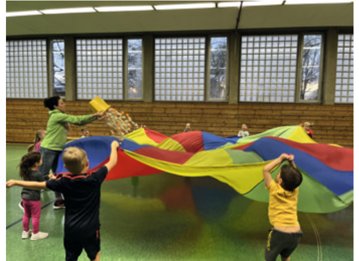
Fit im Vorschulalter (301 und 302) Spielerisches Training der motorischen Grundfähigkeiten für Kinder ab 4 Jahren Dienstags, 16:00 - 17:00 Uhr (Kurs 301) und 17:00 - 18:00 Uhr (Kurs 302) Leitung: Susanne Ayen und Tanja Herter