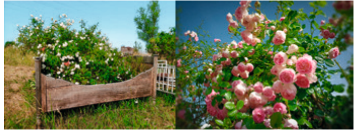
Ein Besuch im Rosenpark steht Jahr für Jahr im Juni auf dem Programm