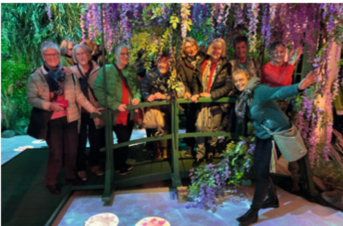
März 2023 - Ausflug nach Stuttgart in Monets Garten