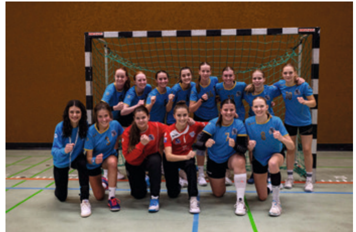
Derzeit Platz 3 in einer starken Bezirksliga: Die weibliche A-Jugend.