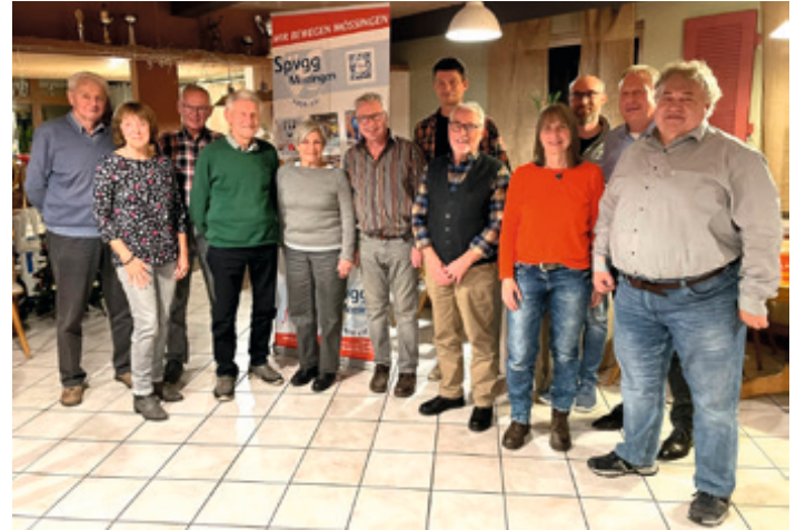
Gruppenbild mit Damen, Dezember

Mehr Informationen zu den Ehrungen in den Amtsblatt-Ausgabe aus Mai und Dezember 2023 (im Archiv auf der Homepage der Stadt Mössingen). Bilder in der Foto-Galerie der Sportvereinigung, Homepage.