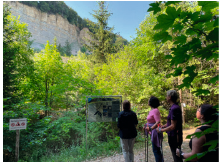
40 Jahre sind nun vergangen, seit der Berg in die Tiefe stürzte und seitdem Mössingens Touristenattraktion Nr. 1 ist.