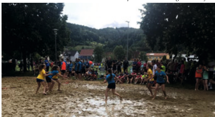
Gleich vier Teams aus dem HiM nahmen am kombinierten Rasen-/Beach-Turnier in Fridingen teil. Das Sommergewitter in der Nacht wird noch lange in Erinnerung bleiben. Und die wB begann die Spiele am nächsten Morgen im Matsch.