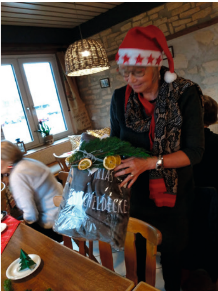
Dezember 2023 - Weihnachtsfeier in der Sportgaststätte Ein kuschliges Weihnachtsgeschenk – vielen herzlichen Dank.