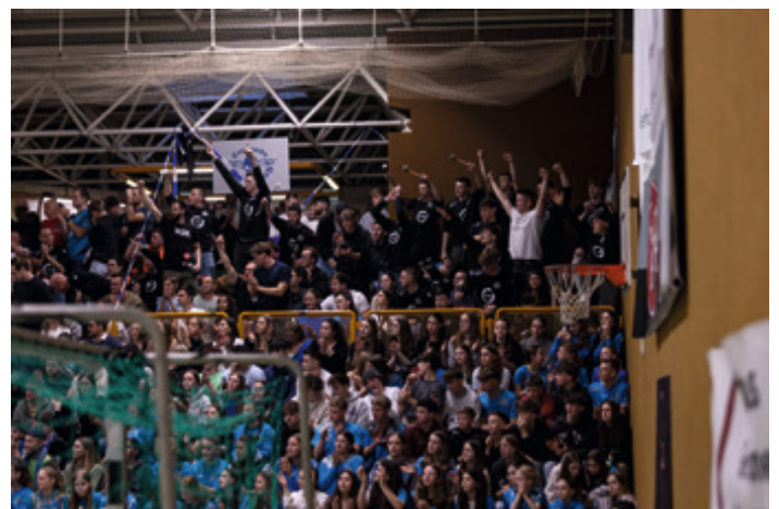
Die Atmosphäre in der Steinlachhalle ist alle zwei Wochen großartig, einen großen Anteil daran hat das Commando Steinlach.

chentlich, wie es eben die Gegebenheiten erfordern und wie die Zeit es zulässt. Eine Abteilungsversammlung wurde einberufen und erfolgreich durchgeführt, Arbeitsbereiche strukturiert und jetzt, Anfang 2024, sind wir an einem Punkt, wo sich langsam aber sicher ein schlagkräftiges Team abzeichnet, welches die Abteilung in eine umtriebige Zukunft führen wird. Es bleibt zu sagen, dass die Teams des Orga-Teams immer offen sind und Mitschafferinnen oder Mitschaffer immer gerne gesehen sind. Es ist sehr schön, dass die Quote der Menschen, die alles nur besser wissen („Ihr müsst...“, „Man sollte...“, „Warum habt ihr nicht...?“) im Handball relativ klein ist. Die Devise ist: Habt Ideen, bringt sie ein und seid auch bereit, sie umzusetzen. Mit diesem Leitsatz als Vorgabe schaut im Orga-Team vorbei und macht mit uns die nächsten Schritte!