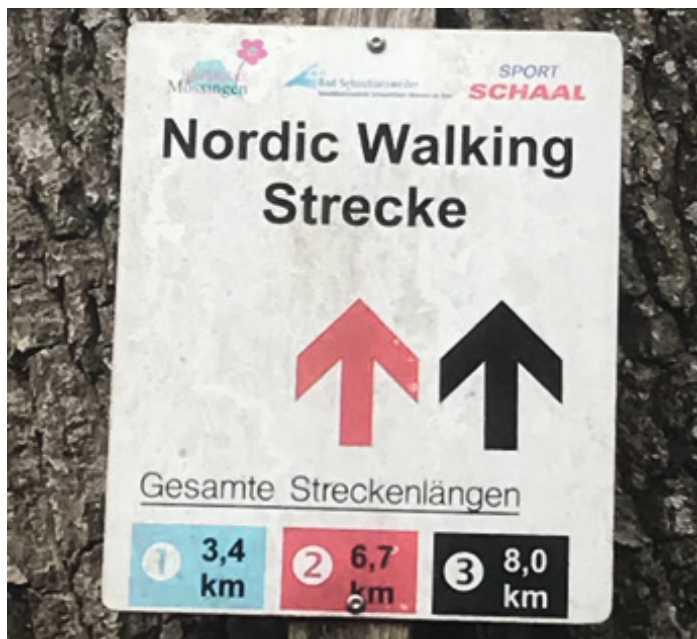
Etwas in die Jahre gekommen, aber immer wieder schön diese Runde im Bästenharter Wald zu laufen.