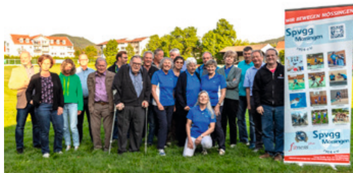
Ehrungsjahr 2021, die Geehrten auf dem Sportgelände der Spvgg. Da strahlt nicht nur die Sonne