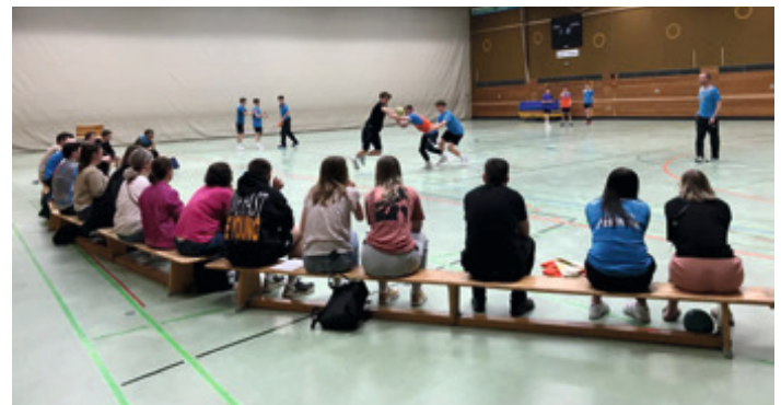
An Menge an Menschen mangelt es im Handball nicht. Durch interne Trainerfortbildungen wird auch weiter an der Qualität gearbeitet.