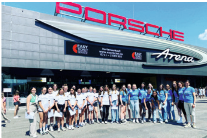
Die Meisterteams aus der weiblichen Jugend besuchten 2023 gemeinsam ein Spiel des TVB Stuttgart Bittenfeld.