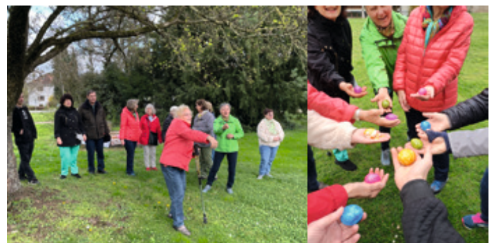
April 2023 - Ostereierwurf- Wettbewerb im Park von Bad Sebastiansweiler