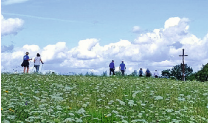
Oben in Beuren auf dem Beurener Elsaweg ist es immer wieder schön.