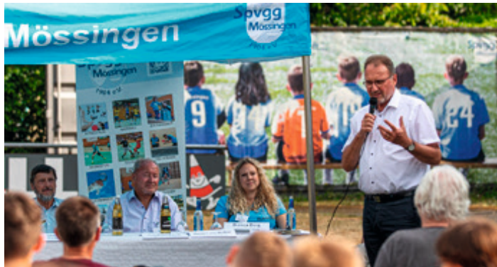
Landrat Joachim Walter

Als Sportverein stellen wir uns dieser gesamtgesellschaftlichen Aufgabe, wir müssen alle auf Augenhöhe mitnehmen und uns gegen jede Form der täglichen Gewalt stellen. Denn Gewalt schafft die Grundlage für weitere Gewalt. Wir müssen alles daran setzen niemanden aus der jungen Generation zu verlieren.