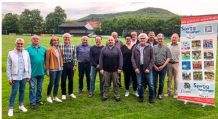
Eine illustre Runde am 1. Ehrungsabends, die meisten aus dem Ehrungsjahr 2019

Das waren sehr kurzweilige, schöne, entspannte und lange Abende mit interessanten und informativen Geschichten, Anekdoten und teils auch Unerwartetes über den Werdegang der Geehrten in der Sportvereinigung. Berichtet wurde über sportliche Erfolge.