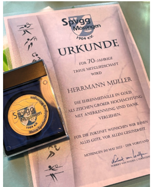
Urkunde und Ehrenmedaille zur Ansicht

Und das dann auch noch zur Beruhigung, als Senioren sind wir nicht zu alt, wir sind nur zu früh geboren.