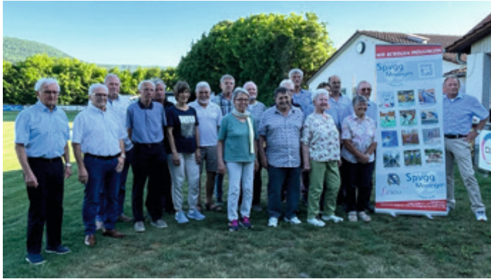
Teilnehmer aus den Ehrungsjahren 2022/23, wieder gute Stimmung bei gutem Wetter