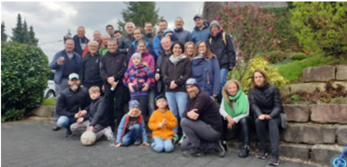
alljährliche Familienwanderung nach Beuren

Fußballerisch versuchten wir uns nach sehr langer Zeit mal wieder auf Großfeld beim elf gegen elf gegen Hirschau und trennten uns verdient mit 2:2 unentschieden.