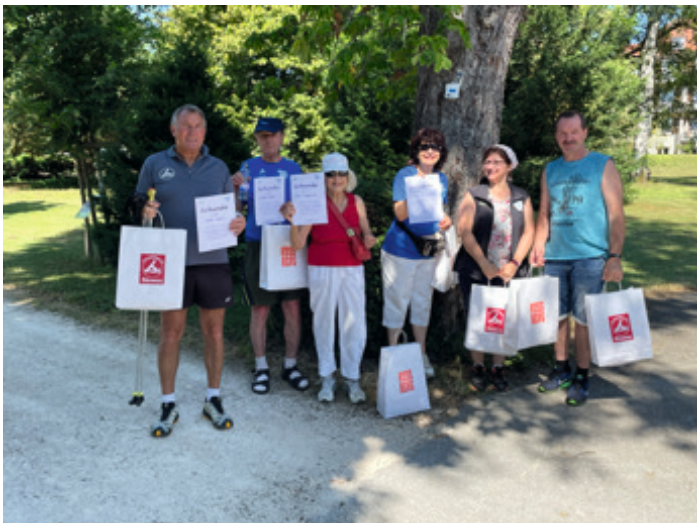
Sie waren dieses Jahr dabei und konnten zufrieden mit den bewährten Sponsorenumedeln der Firma Rossberg, und einem guten Gefühl etwas für ihre Gesundheit getan zu haben, nach Hause gehen.