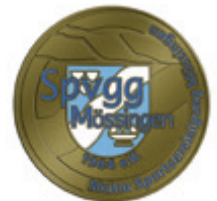
Medaillen für 60, 65 und 70 Jahre Mitgliedschaft